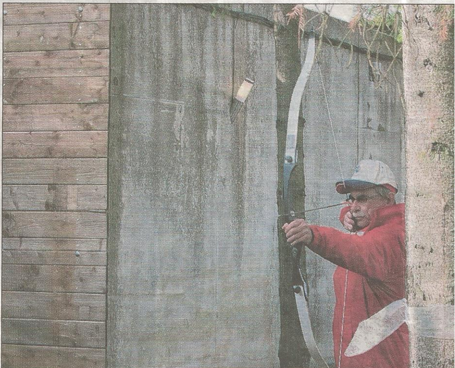
Une inauguration toute teintée de tradition.

À l'image de l'inauguration, à laquelle étaient invitées d'autres compagnies de la